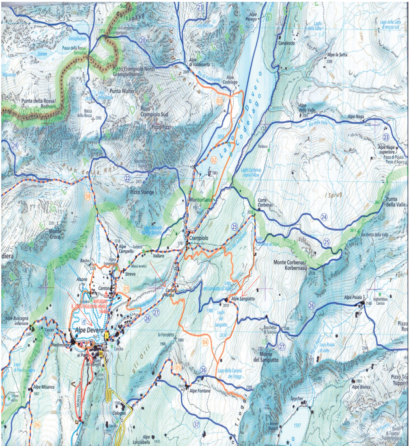
Mapa. Alpe Devero – Alpe Sangiatto